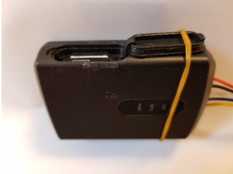
Afb.1. de simkaart hoort op deze manier in het systeem

Bij enkele systemen is ontdekt dat het klepje de simkaart raakt bij het sluiten waardoor de simkaart wordt los geklikt. Na verloop van tijd kan het klepje open trillen met gevolg dat de simkaart geen contact meer maakt. (zie afb. 1 en afb. 2)