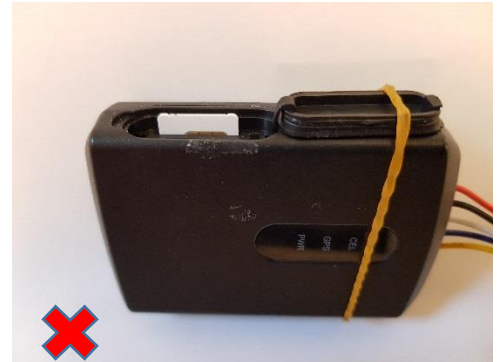
Afb.2. de simkaart komt bij enkele systemen omhoog door het afdekkapje

Op het moment dat dit is geconstateerd is het eenvoudig op te lossen door een klein randje van de bovenkant van de simkaart af te knippen.